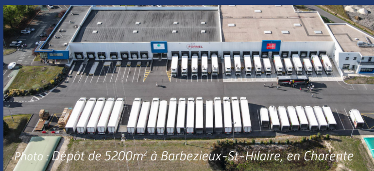
Photo : Dépôt de 5200m 2 à Barbezieux-St-Hilaire, en Charente

Au fil des années et des générations, l'entreprise a connu d'importants changements. Nous avons su nous adapter à nos clients en restant attentifs et à l'écoute de leurs besoins. Cela se traduit par la création de nouveaux services et la re-