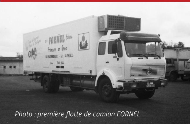
Photo : première flotte de camion FORNEL