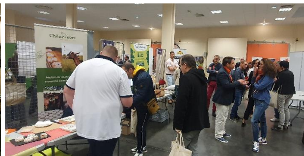
Vues du salon des fournisseurs des Rencontres professionnelles 2022 au Futuroscope (86)