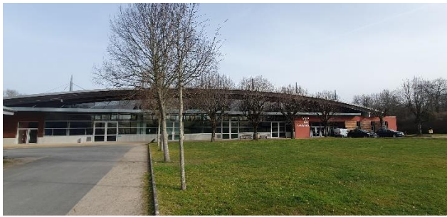
Vue extérieure de la salle des congrès

Ces 8èmes Rencontres Professionnelles auront lieu dans la salle des Congrès de Saint-Junien (87). L'espace sera partagé en 3 grandes parties : un hall d'accueil (accueil, démos culinaires, restauration du midi), une grande salle dédiée au salon des fournisseurs et un espace dédié aux ateliers et conférences.