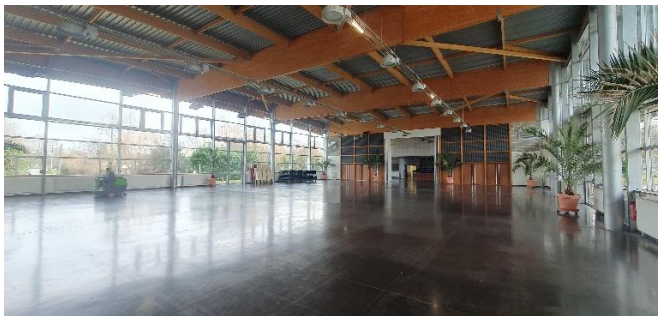
Vue de la salle dédiée salon des Fournisseurs