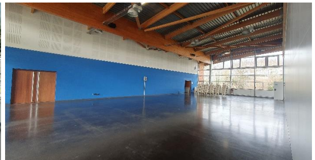
Vue de l'espace dédié ateliers et conférences